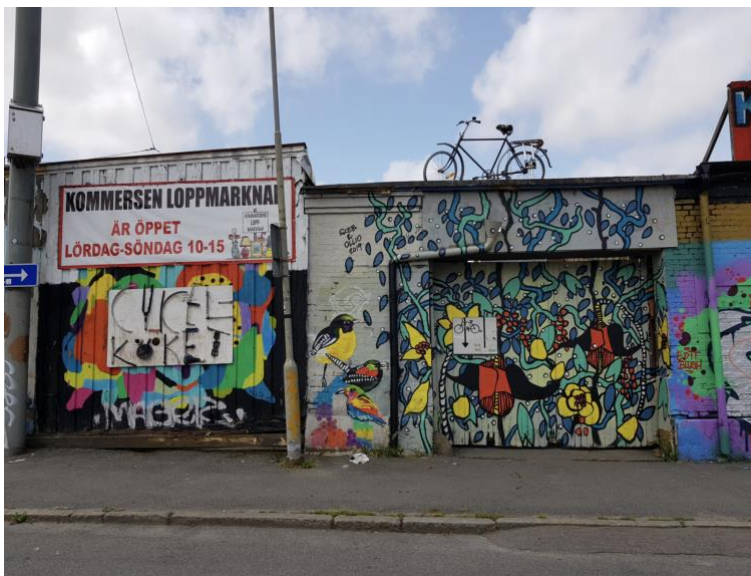
Bild på Kommersen från 2019. Kommersen var en välkänd loppmarknad och mötesplats vid Masthuggstorget, där handel, återbruk och sociala sammanhang möttes. Platsen är idag riven.

Med yrkesverksam konstnär avses i detta sammanhang en person med minst treårig konstnärlig högskoleutbildning eller motsvarande merit.