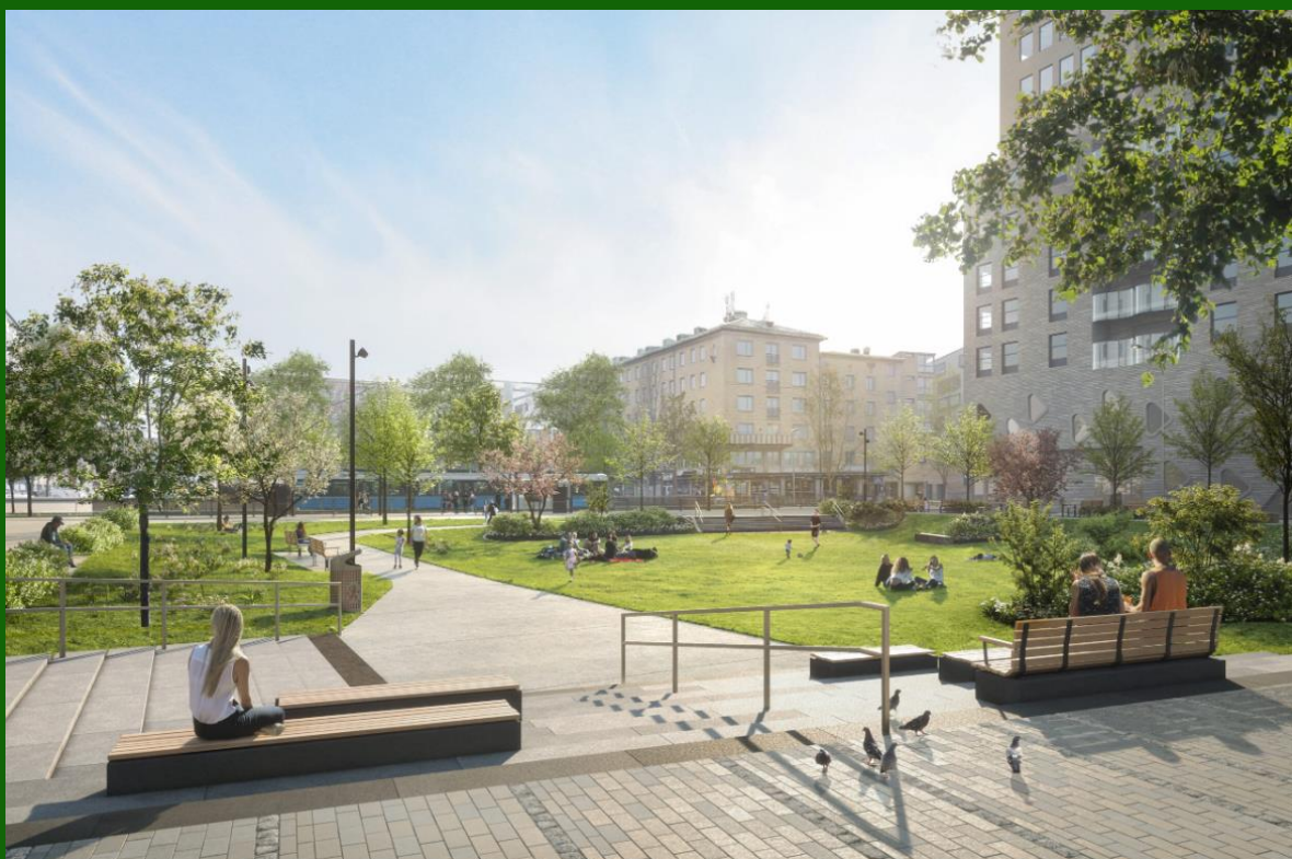
Visionsbild av Masthuggsparken. Till höger i bild Fastighet G6 Poseidon.