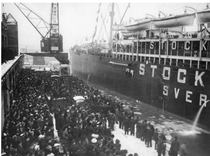
Emigrantfartyget Rollo lämnar Masthuggskajen i Göteborg, cirka år 1900.

Historiskt har Masthuggskajen fungerat som ett nav för Göteborgs och Sveriges ekonomi, handel och sjöfart. Namnet ”Masthugget” kommer från den skeppsmasttillverkning som bedrevs i hamnområdet, där det även bedrevs omfattande trähandel och varvsindustri. Under andra halvan av 1800-talet ökade behovet av kajer markant, då fartygsstorlekarna växte och industrin utvecklades snabbt. Mellan 1888 och 1902 byggdes Masthuggskajen som Göteborgs första kaj för oceangående fartyg – en viktig milstolpe i hamnens utveckling till storhamn.