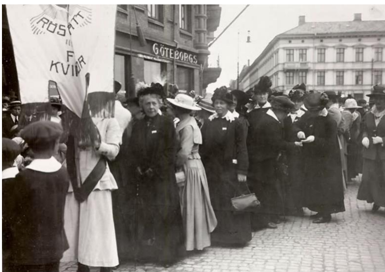
Järntorget 1918. Demonstrationståg i protest mot att riksdagen fällt en proposition om kvinnlig rösträtt.

Läs mer om platsens historia, civilsamhälle, kulturmiljöer, pågående konstverksamheter och befintlig konst i Bilaga 4 – Förstudie för konstgestaltning till Fastighet G6 Poseidon, Västra Masthuggskajen.