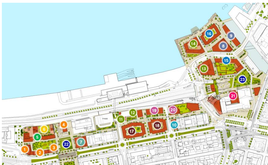
Nr 3 är den fastighet som är aktuell för konstgestaltning, kvarter G6. Illustration: Älvstranden Utveckling

Konstgestaltningen ska ta avstamp i platsens historia och det sociala engagemang som länge präglat området, och bidra till nya sätt att förstå och erfara en stadsdel i förändring.