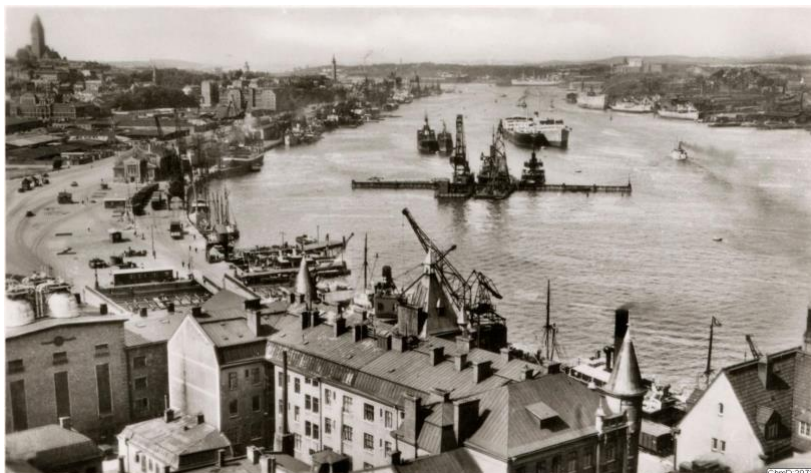
Göteborgs stadsmuseum, ca år 1935

Historiskt har Masthuggskajen fungerat som ett nav för Göteborgs och Sveriges ekonomi, handel och sjöfart. Namnet ”Masthugget” kommer från den skeppsmasttillverkning som bedrevs i hamnområdet, där det även bedrevs omfattande trähandel och varvsindustri. Under andra halvan av 1800-talet ökade behovet av kajer markant, då fartygsstorlekarna växte och industrin utvecklades snabbt. Mellan 1888 och 1902 byggdes Masthuggskajen som Göteborgs första kaj för oceangående fartyg – en viktig milstolpe i hamnens utveckling till storhamn.