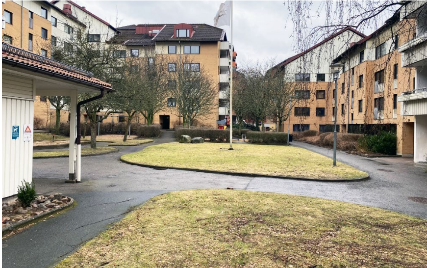
"Giraffens gård" mellan Borgaregatan och Hökegatan