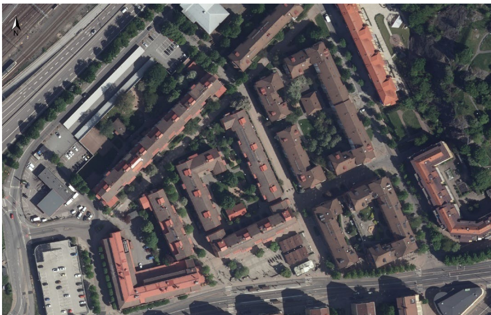
Västra delen av Olskroken