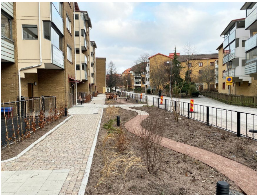
Olskrokgatan 4-18 med den upprustade förträdgården

Platserna är väl synliga från gatan och det finns längre siktlinjer längs Olskrokens gatusträckning eller från tvärgatan Bondegatan. Minst en del av konstgestaltningen skall vara placerad längs Olskrokgatan 4-18.