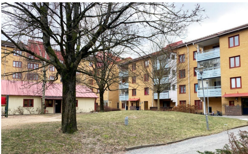
"Oxens gård" mellan Bondegatan och Borgaregatan

Det finns möjligheten att placera konst inne på de två gårdarna mellan Bondegatan, Borgaregatan och Hökegatan. Här erbjuds en något intimare miljö för de boende, synlig från alla lägenheter i de omgivande husen och för besökare. Delar av en konstgestaltning på gårdarna kan placeras på olika platser i samråd med Bostads AB Poseidon. Gårdarna är sekundära platser och möjliggör för en konstnär/konstnärsgrupp att bre ut konsten i området/skapa en konstgestaltning i flera delar.