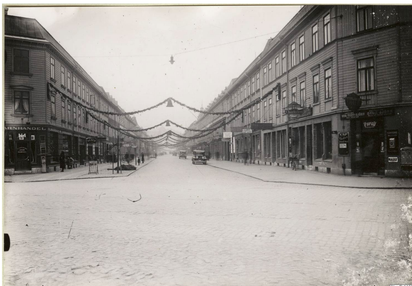
Olskroksgatan 1935

Olskroken har också länge varit en trafikknutpunkt. Västra stambanan drogs genom Olskroken och i början av 1900-talet, och fram till 1964 hade Olskroken Sveriges största järnvägsstation. Idag är spårområdet norr om bostadskvarteren en av Sveriges mest trafikerade järnvägsknutar. Samtidigt så möts vägarna E20 och E6 vid Olskroken för att förenas i sydlig riktning. Gullbergsån, som vid Olskroken har bytt namn från att tidigare varit Mölndalsån, rinner i anslutning till Olskroken för att möta Säveån och Göta kanal. Ån är idag till stora delar överbyggd, men har historiskt utgjort en trafikerad vattenväg. Vattendraget är hem åt fiskarter som abborre, benlöja och braxen, och den fridlysta vattenväxten knölnate har påträffats.