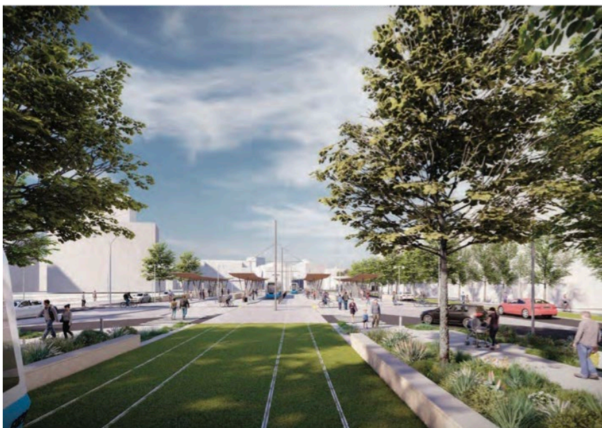
Visionsbild Brunnsbo-Linné, bild Göteborgs Stad