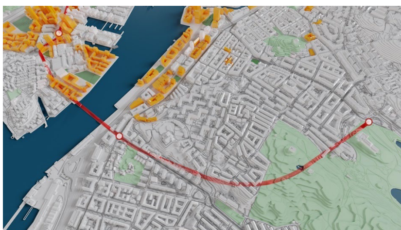
Bilden visar Lindholmsförbindelsens sträckning.

Spårvägsprojektet omfattar ett stort och varierat område som sträcker sig mellan Lindholmen och Linnéplatsen under Göta älv och genom Stigberget. Om man reser från Lindholmen kommer förbindelsen att röra sig från markplan söderut, där den ansluter till befintlig spårväg från Lindholmen genom ett tunneltråg till en sänktunnel under Göta älv och vidare till Stigberget, där en ny underjordisk hållplats byggs under Stigbergstorget. Från Stigberget går förbindelsen vidare söderut och ansluter till Linnéplatsen strax öster om Göteborgs Naturhistoriska museum. Vid Linnéplatsen ska förbindelsen gå upp i ett tråg där spåren når marknivån vid hållplats Linnéplatsen och knyter an till befintlig spårväg.