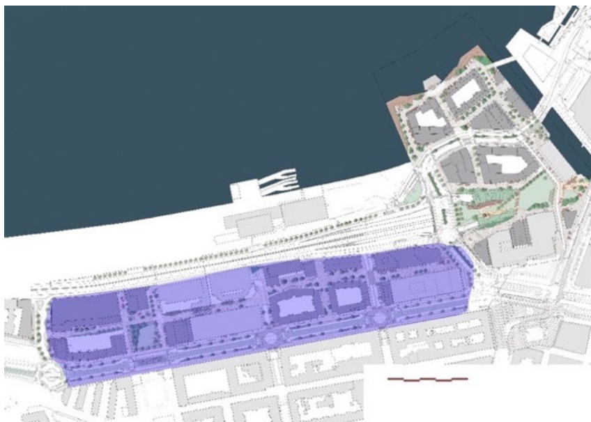
Delområde 2. Västra delarna av Masthuggskajen. Illustrationsplan Ramboll/Sweco Bild Göteborg Konst.