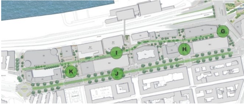
Delområde 2. Identifierade möjliga platser som beskrivs ovan (G-J). Illustrationsplan Ramboll/Sweco.