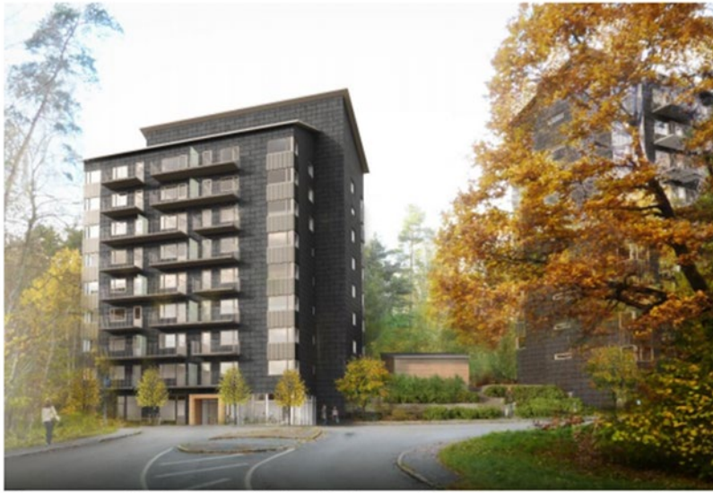
Fotomontage från korsningen Robertshöjdsgatan/Smörslottsgatan. Husen är illustrerade med fasad i skiffer med plåtdetaljer som markerar vissa hörn.