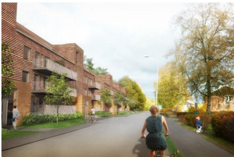
Fotomontage Norconsult: Bebyggelsen längs Robertshöjdsgatan, byggnaderna hålls i detta läge ner i byggnadshöjd för att bevara ett småskaligt gaturum.

Krav om säkerhet, brandrisk, tillgänglighet och hållbarhetsaspekter ska tas i beaktande och görs i samråd med beställaren. Placeringen av konstgestaltningen kommer att vara i de boendes närmiljö, därför måste störningsaspekter beaktas rörande till exempel ljud och ljus.