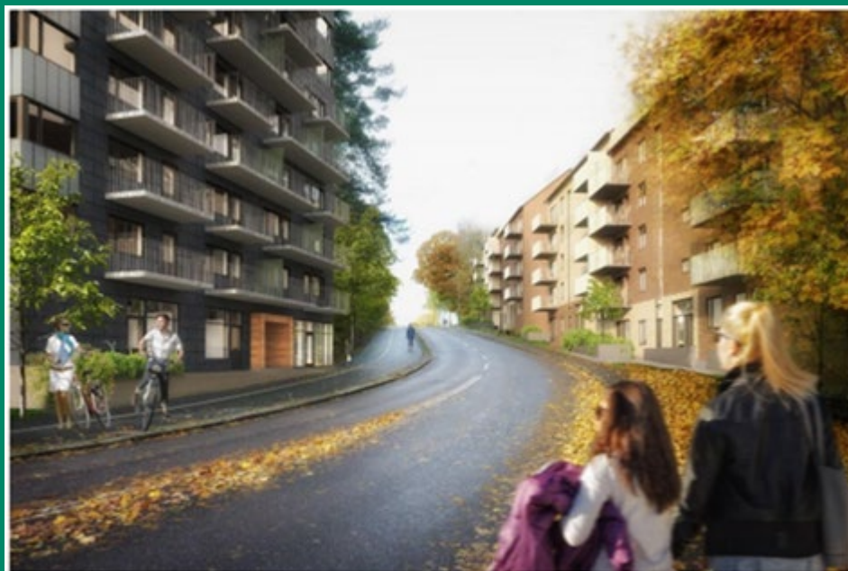
Fotomontage, Norconsult: Bebyggelsen längs Smörslottsgatan. Till vänster syns punkthus i område A. Till höger lamellhusbebyggelse i område B.